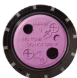
I-40 с указателем технической воды

▶ = Описания специальных функций приведены на стр. 18